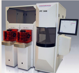
„PT 300“ Dünnwafherhandling-Tool der Mechatronic Systemtechnik

Die mechatronic Systemtechnik GmbH entwickelt, fertigt und vermarktet Systemlösungen für die Halbleiterindustrie. Dabei hat das Unternehmen Handlingsysteme für sogenannte Dünnwafher entwickelt, die die Basis für Leistungs- und Speicherchips der kommenden Generation sind.