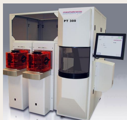
„PT 300“ Thin Wafer Handling Tool from Mechatronic Systemtechnik

mechatronic Systemtechnik GmbH develops, manufactures and markets system solutions for the semiconductor industry. The company has developed handling systems for so-called thin wafers which are the basis for next generation performance and memory chips.