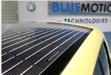
VW E-Up! roof with thin-film solar cells from Solarion